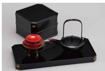
04-09 八角屠蘇器(蒔絵・四君子)