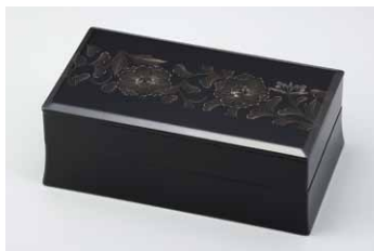
04-01 長角オードブル (プラチナ牡丹唐草)

輪島塗は「高級品」の印象が強いですが、価格に見合っただけの手まひまと品質の良さを持っています。使い続けることでその良さを実感して頂けるような商品を私共は自信を持ってお届けします。