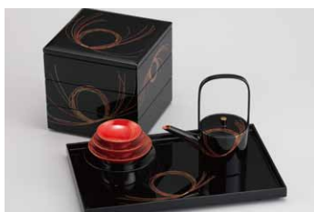
04-07 姫屠蘇器(蒔絵・水引)

●色：根来 ●サイズ：04-05・6 18.2×18.2×18.2 04-05・7 21.3×21.3×22.5