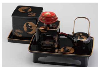
04-11 胴張屠蘇器(蒔絵・鶴丸)